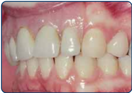
Plaatprothese van opzij