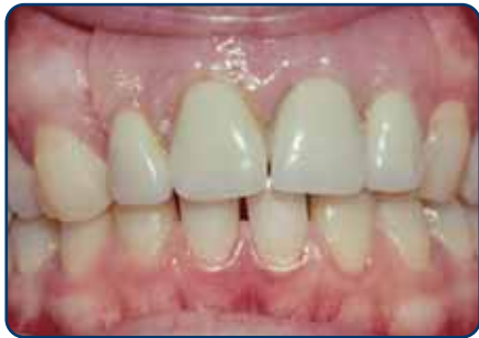
Plaatprothese van voren

De plaatprothese is gemaakt van een roze, tandvleeskleurige kunsthars. Daarin zijn de kunsttanden en -kiezen verankerd. De gehele plaatprothese rust op het slijmvlies van de mond. Deze zit eventueel met ankertjes vast aan overgebleven tanden of kiezen.