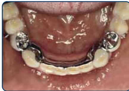
Frameprothese met verankering op kronen