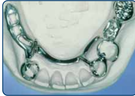
Frameprothese in wording op een gipsmodel, zonder kunsttanden en -kiezen

soort slotje. Bij een slotje wordt de ene kant vastgemaakt aan een kroon, tand of kies en de andere kant zit vast aan de frameprothese. De frameprothese kunt u op die manier in het slotje schuiven. Het slotje zit doorgaans aan de binnenkant van de tanden en kiezen en is dus niet vanaf de buitenkant zichtbaar. Ankertjes zijn vaak wel enigszins zichtbaar.